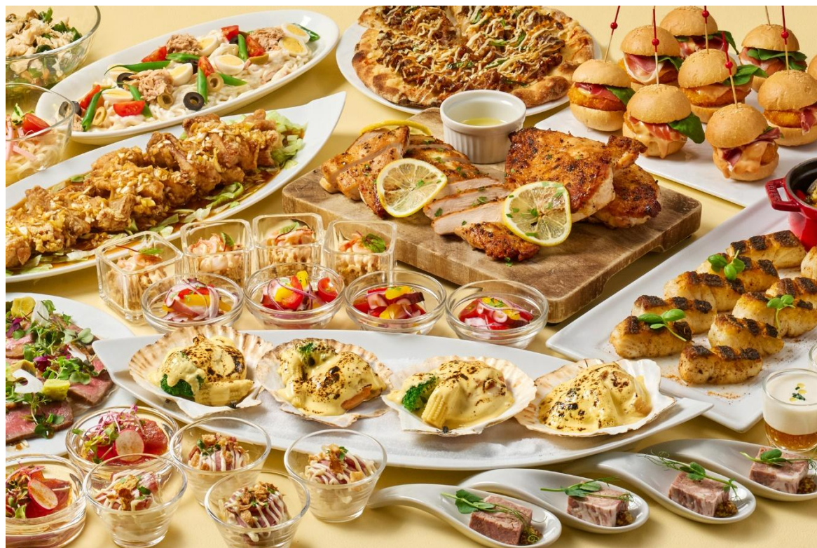
サマーランチビュッフェ(イメージ)

夏休み期間中のご家族でのお出かけや、ご友人とお集まりの機会には、世代を問わず楽しめる当ホテルのランチビュッフェをご利用ください。