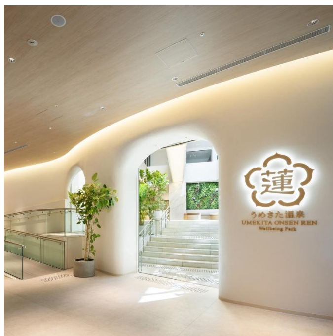
うめきた温泉 蓮 Wellbeing Park