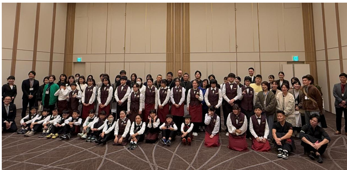
「Let's エンジョイ ホテルマンになってみよう！」昨年度の様子

ホテルグランヴィア広島（広島市南区松原町 1-5、総支配人：島田正義）は、2026 年 2 月 11 日（水・祝）にお子さまお仕事体験イベント「Let's エンジョイ ホテルマンになってみよう！」を開催いたします。