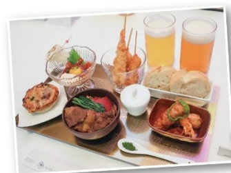
オードブル盛り合わせのイメージです