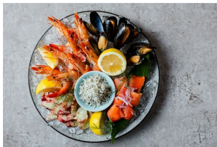
瀬戸内の海の幸を味わう「シーフードマルシェ」

2026年1月1日(木・祝)～2月28日(土)のご宿泊を対象に、JR ホテルメンバーズ会員優待でのご予約にも WESTER ポイントを付与(※1)いたしますので、ダブルでポイントがたまっておトクです。さらに WESTER ポイントは通常の5倍(※2)を付与いたします。 スペシャルオファーも本キャンペーンの対象です。