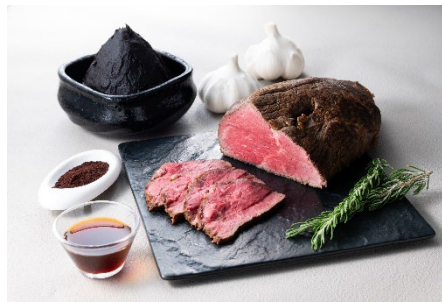
特製のボン酢ソースで味わう 黒毛和牛のローストビーフ