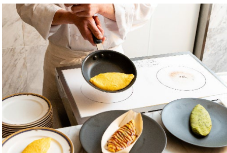
大阪名物「たこ焼き風」スタイルなど 平飼い卵を使用したオムレツ3種

天下の台所「大阪の食文化」や「大阪の味」を感じる朝食buffetが無料の特典付きプラン。目の前でシェフが仕上げるオムレツやローストビーフをはじめ、鮑と茸のソテーなど、洋食・和食の豊富なメニューをお好きなだけお楽しみいただけます。