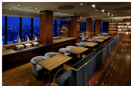
グランヴィアラウンジ