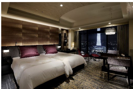
客室「グランヴィアデラックスツインタワービュー」

ニデック京都タワーを目前に望む迫力のパノラマを客室から。さらに、グランヴィアフロア宿泊者専用ラウンジ「グランヴィアラウンジ」で専任スタッフのサービスやドリンクをお楽しみいただけます。