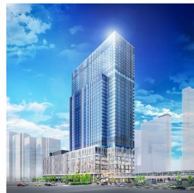
建物外観イメージ（JR大阪駅前から）