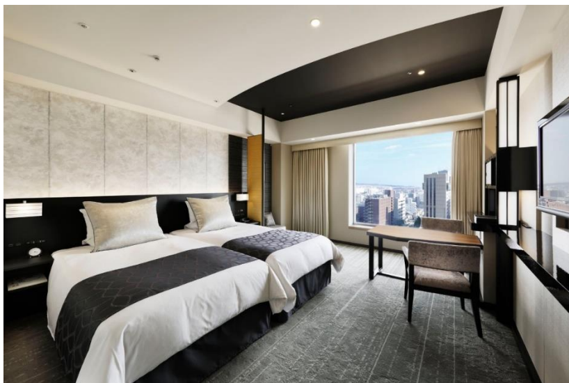
ホテルグランヴィア京都客室イメージ

JR西日本ホテルズでは、お客様とともに持続可能な社会を目指すべく、すでに販売を行っている「CO2ゼロ MICE」に加え、この度は宿泊するだけでCO2削減に貢献できる宿泊プランの販売を全てのホテルで用意いたしました。