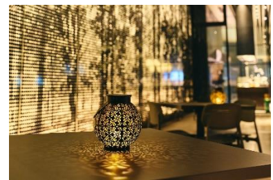
ホテルヴィスキオ大阪 今年のレストランライトダウンの様子