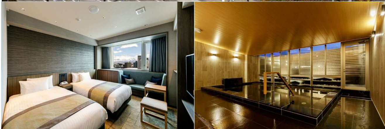
上：ホテルヴィスキオ富山（J R富山駅ビル）全景 下左：スーパーイアツインルーム 下右：大浴場 ※画像はイメージ