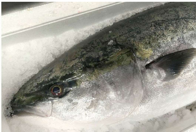
左：「ぶりしゃぶ」 右：富山湾の王者「寒ぶり」 ※画像はイメージ