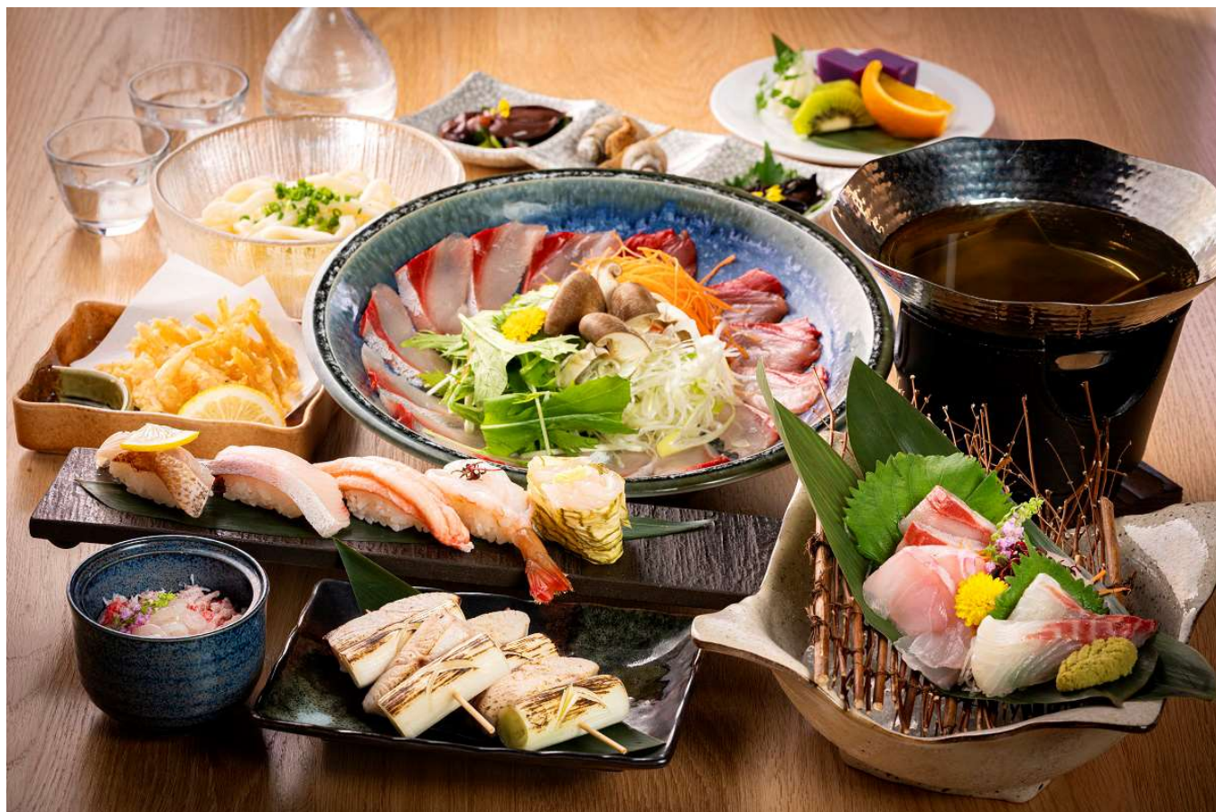
プレミアム宿泊プラン「ぶりしゃぶコース」夕食イメージ

今回のプランでご提供する夕食は、冬季限定の「ぶりしゃぶと厳選お鮨のコース」をご用意しました。年間を通して豊富な魚種が水揚げされる天然のいけす富山湾。中でも「富山県のさかな」として選定された「ぶり」は古くから縁起物として県民に愛され、特に12月～2月に漁の最盛期を迎える「寒ぶり」は丸々と太ったその大きな体から「富山湾の王者」と称されます。たっぷりと脂の乗った「寒ぶり」を、ぶりのねぎま串、ぶりしゃぶなどでご提供します。また、富山湾の宝石「白海老」や「紅ずわい蟹」、その他にも名店「とやま鮨」の仕入れのプロが毎日漁港へ訪れて仕入れる、鮮度抜群な「海」の幸を使ったお寿司や地元逸品料理など「富山」の食の魅力を存分にお愉しみください。