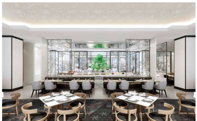
右：レストラン店内パース図 ※CG イメージ