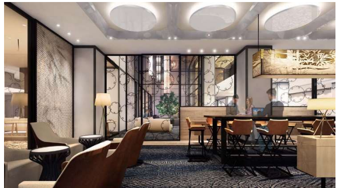
右：宿泊者専用ラウンジパース図 ※CG イメージ

テーブル&ソファを設置し、ゆったりと寛いでいただける宿泊ゲスト専用ラウンジ。滞在中の宿泊ゲストが簡単なミーティングや歓談などに利用できる空間としています。客室内同様に無料でWi-Fiを利用できる快適なインターネット環境を整備しています。