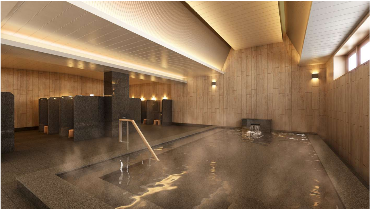
ホテルヴィスキオ京都 大浴場パース図 ※CG イメージ